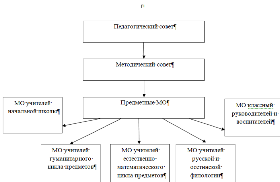
Структура методической службы школы.

Эти направления затрагивают всех участников образовательного процесса и позволяют решать проблемы на всех уровнях управления, которые включены в организационную структуру методслужбы в школе.